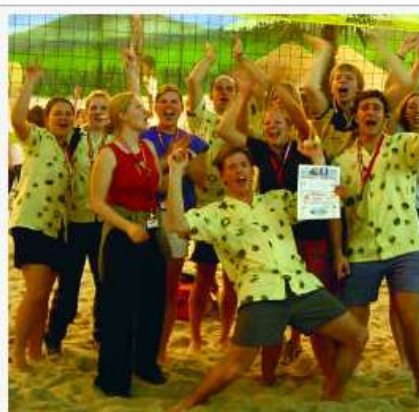
Super gute Stimmung ist angesagt auf dem Spielplatz der Beachvolley-Spielerinnen und Spieler.