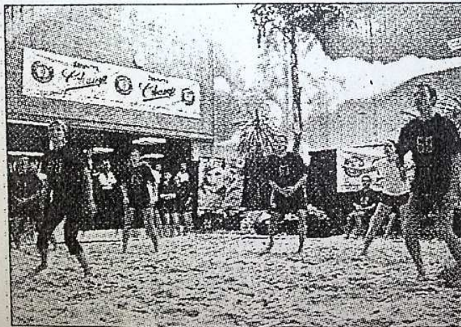
Lauschige 28 Grad Celsius und Sand unter den Füßen: Das Finale des „Gong 96,3 Peugeot Office Beach Cup“.

Und trotzdem: Für Architekten, Bedienungen, Krankenschwestern, Banker und Putzfrauen stand im Wesentlichen der Spaßfaktor im Vordergrund. Und dafür sorgte Radio Gong 96,3 mit reichlich Caipirinha – und natürlich mit dem, was die heiße Radiostation aus Schwabing am besten kann: mit jeder Menge Hits – aufgelegt von Gong 96,3 DJ Master Karsten Kiessling.